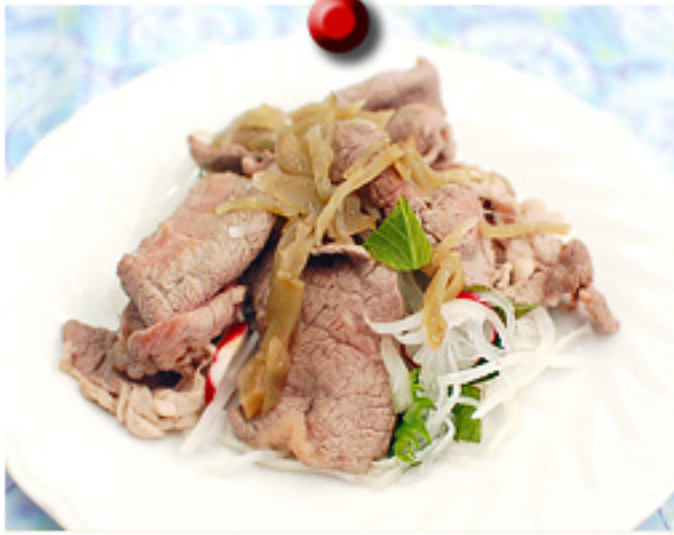
オージー・ビーフの大根のサラダ (甘酢ドレッシング)